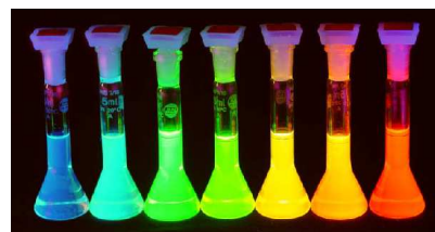
Emission de QDots sous excitation UV

Nous proposons donc de combiner ces deux approches pour obtenir un matériau luminescent structuré dont les propriétés d'émission vont être modifiées. La majeure partie du stage sera basée au laboratoire de Chimie de la Matière Condensée, pour la synthèse et la caractérisation des Q-Dots. L'impression des couches obtenues sera effectuée à Saint-Gobain.